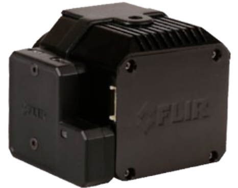
전원/비디오 모듈이 추가된 Vue Pro R